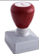
④ 35 × 35mm