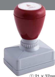
① 21 × 37mm

#123 aobaBldg 1-5-6 Oyaguchi Kitacho, aobaku, Tokyo 173-0031 Japan TEL03-1234-5678 FAX03-2345-6789