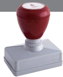
① 26 × 49mm