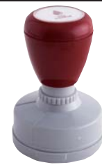
④ 直径 35mm