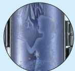
②エルサのシルエットがデザインされた上品な印鑑セット